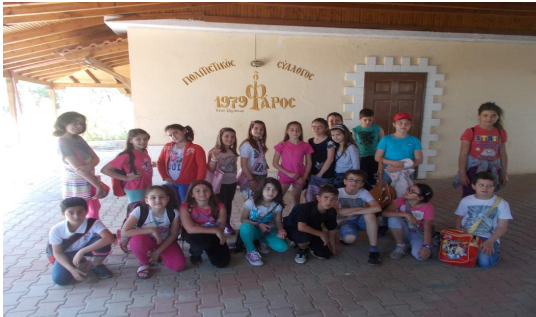
Οι μαθητές της Δ'1 τάξης του 2 ου Δημοτικού Σχολείου Ν. Μουδανιών

Αληθινή μαρτυρία παππού ενός μαθητή της Δ' 1 τάξης του 2 ου Δημοτικού Σχολείου Ν, Μουδανιών, κύριο Τερτιλύκο Νίκο, όπως τα έχει ακούσει από τον πατέρα του, κύριο Τερτιλύκο Εμμανουήλ